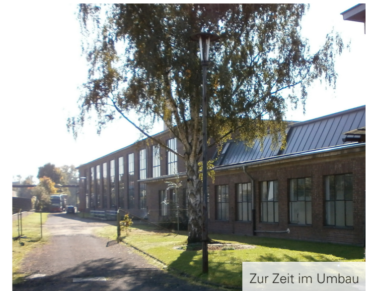
Zur Zeit im Umbau