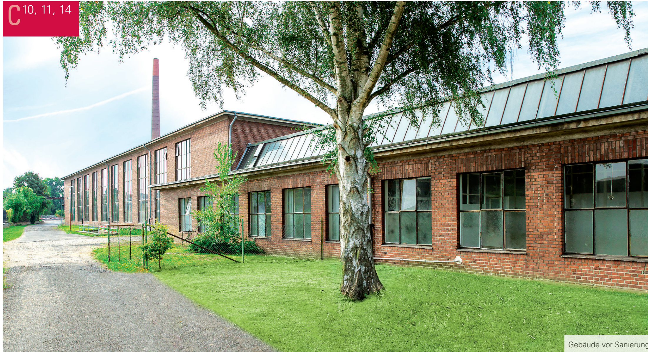
Gebäude vor Sanierung